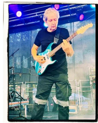
Rainer Hamacher Gitarren